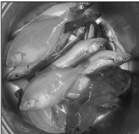
foto: Een lekker maaltje schar en wijting, gevangen (en gefotografeerd) door Jeroen Jonkers medio oktober.