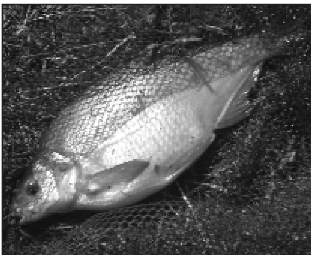
foto: Een brasem van 57 centimeter is toch een hele knaap.